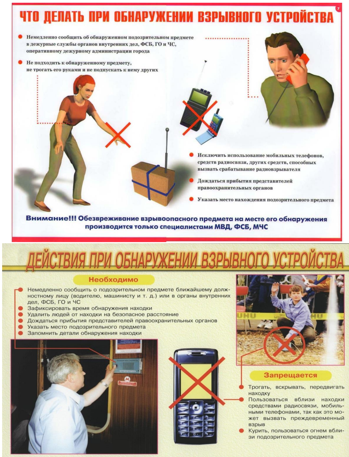
Рисунок В.2 – Действия при обнаружении взрывного устройства

В.2.1 На рисунке В.2 представлен порядок действий при обнаружении подозрительного предмета.