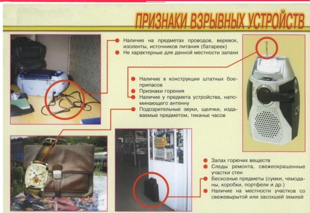
Рисунок В.1 – Признаки взрывного устройства