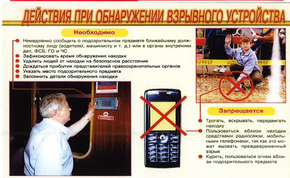
Рисунок В.2 – Действия при обнаружении взрывного устройства