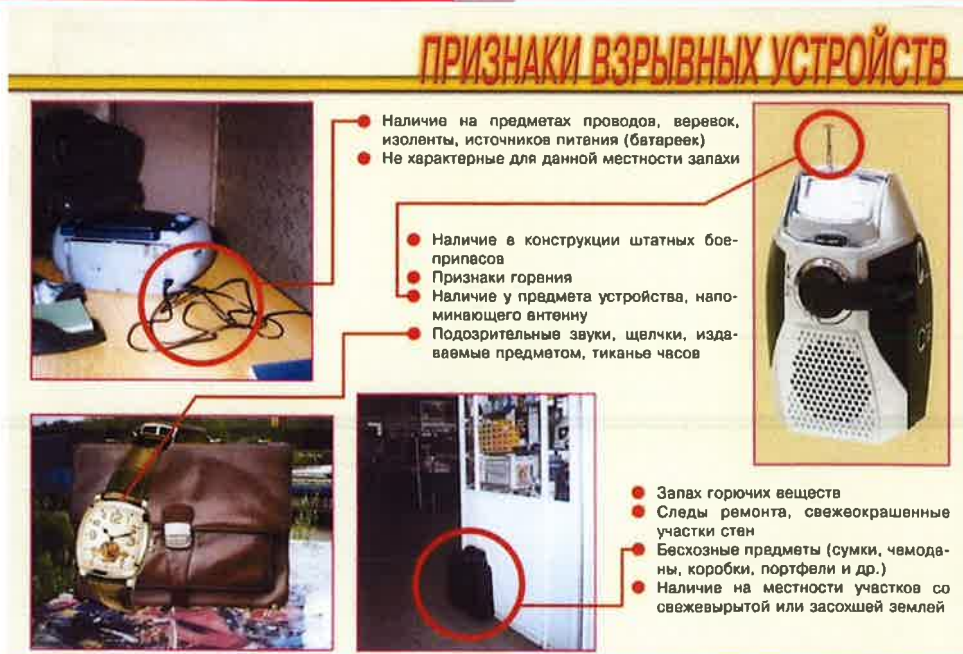
Рисунок В.1 – Признаки взрывного устройства