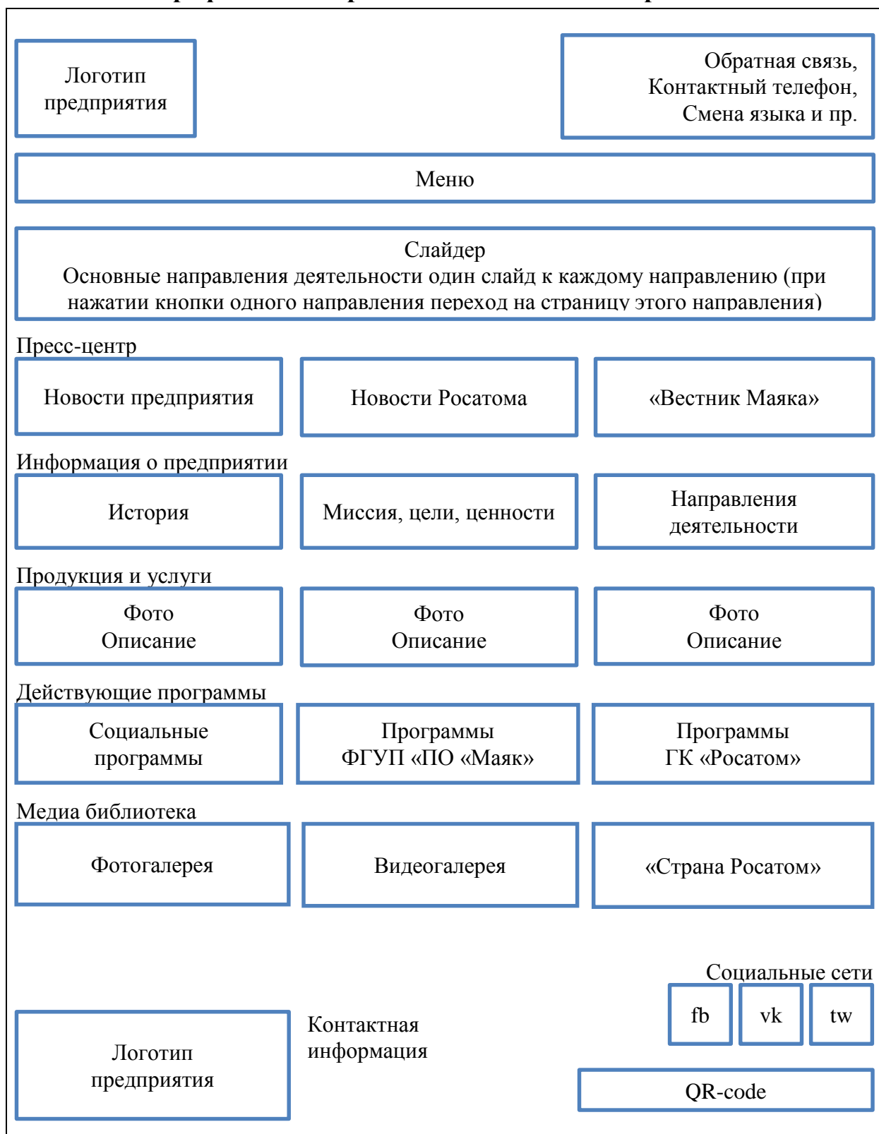
Схема графического представления главной страницы сайта